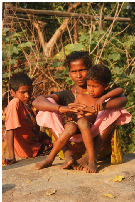
आदिवासी माँ अपने बच्चों के साथ

परिवारों में बहुत प्रबल सहयोग की भावना होती है. वे जन्म, शादी, मृत्यु आदि के अवसर पर एक-दूसरे की बहुत सहायता करते हैं. इन अवसरों पर लोग धान, काला चना, महुए का नशीले पेय भेंट देते हैं और साथ में साल पेड़ के पत्तों से दोने / पत्तल बनाने में भी मदद करते हैं.